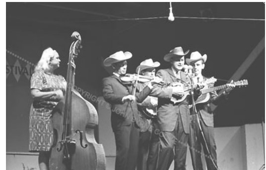
Les "Blue Grass Boys"

Bill et Charlie, en raison de leur tempérament peu accordé, se séparent, chacun fondant son propre orchestre. Charlie choisit de se fondre dans la mouvance honky tonk, tandis que Bill le plus jeune, entreprend une toute autre démarche.