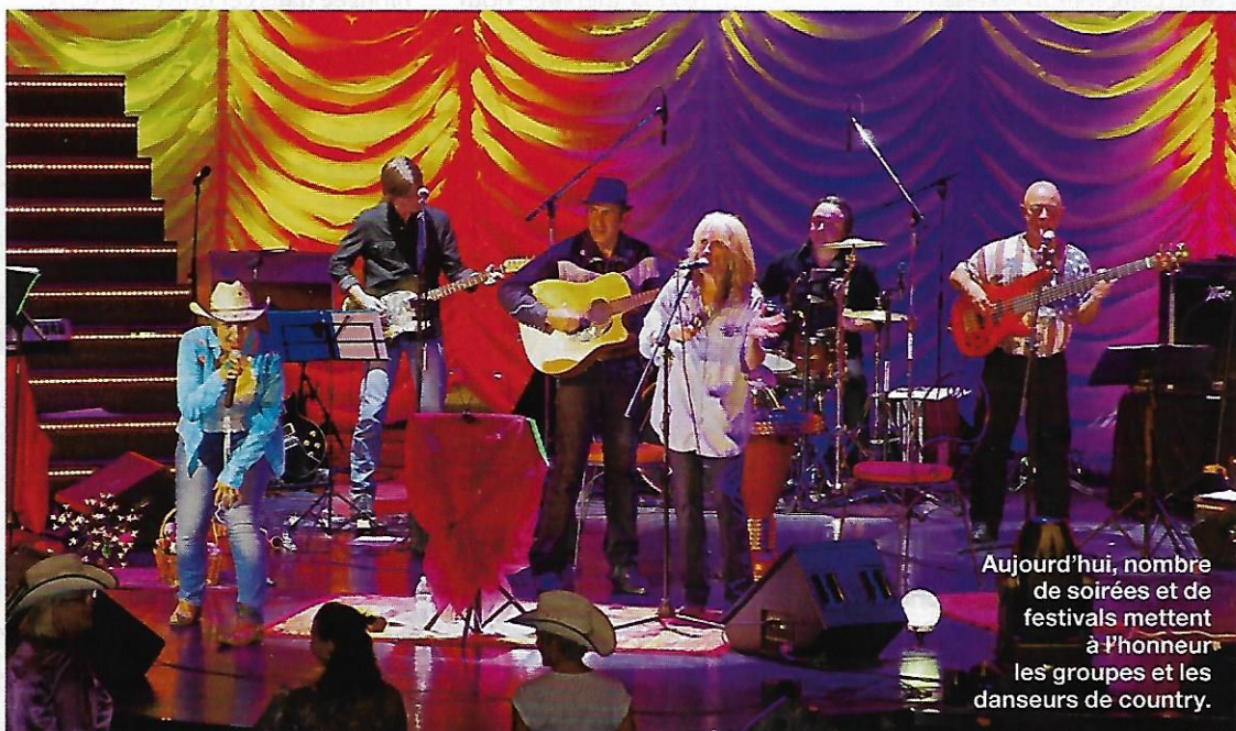
Aujourd'hui, nombre de soirées et de festivals mettent à l'honneur les groupes et les danseurs de country.